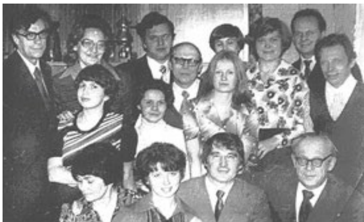
Рис. 5. Группа преподавателей кафедры матобеспечения ЭВМ и сотрудников ВЦ ЛГУ в 1970-х годах